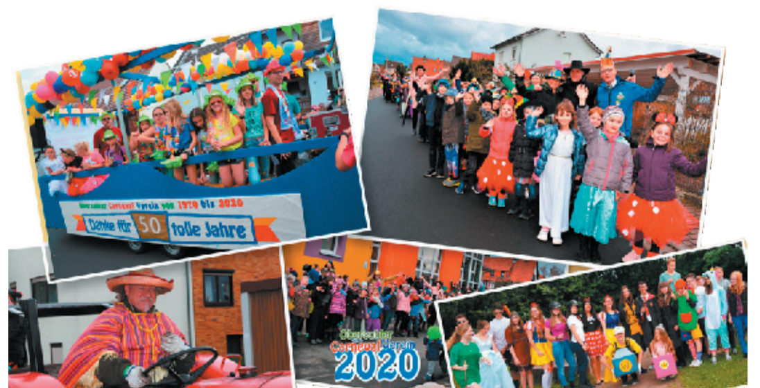
Beim Rosenmontagsumzug erhoffen sich die Organisatoren über 1.000 Teilnehmer.

Der Zug soll am Montag, 24. Februar, gegen 10 Uhr an der BSO starten und um 11:11