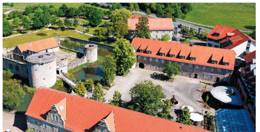
Die Gemeinde Friedewald ist in diesem Jahr eine von drei hessischen Kommunen, die vom Hessischen Literaturrat eine Autorenresidenz für 2 Monate erhält.