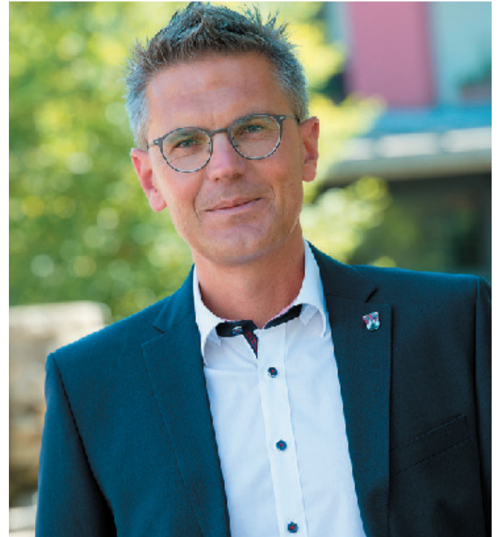
Friedewalds Bürgermeister Dirk Noll.